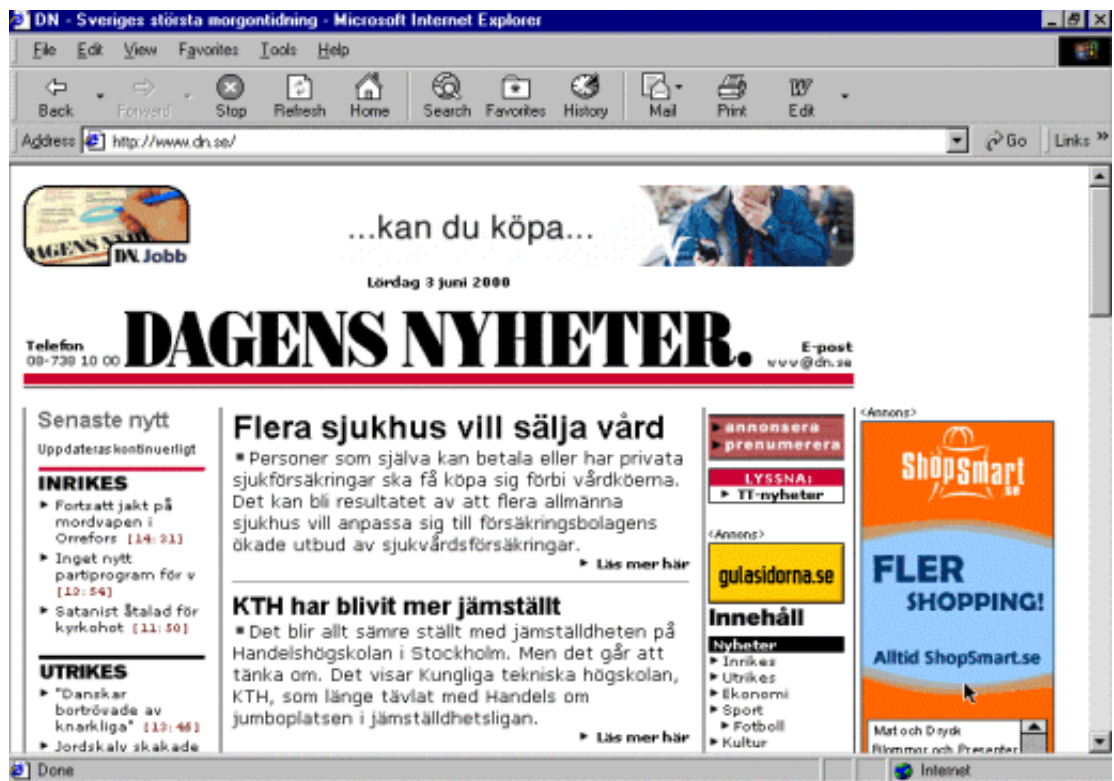
Figur 1: DN:s förstasida på nätet, 3 juni 2000

Att alla tidningar har sina olikheter är allom bekant och det gäller förstås även nättidningarna. På ytplanet stämmer dock DN:s och SvD:s nättidningar in på de flesta av "nättidningspunkterna" ovan – de använder typsnitt utan seriffer, har små och få bilder och förhållandevis korta artiklar. I övriga avseenden har dock DN och SvD valt ganska olika lösningar för sina nättidningar.