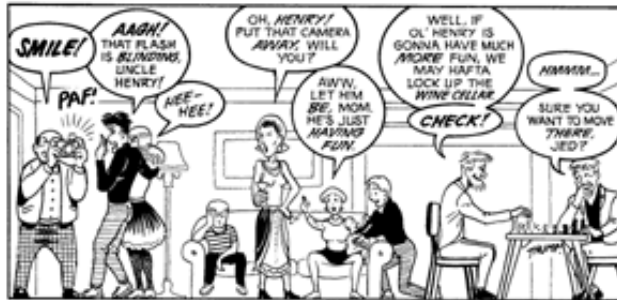
Ur Scott McCloud, Understanding Comics .

Före renässansen och centralperspektivets genombrott skilde man inte lika noga som idag på tids- och rumsdimensioner i bilder, ett drag som levtt kvar i bland annat ikonmåleri och folkliga bilder. Samma personer kan avbildas vid flera olika tidpunkter inom ett bildrum, vilket med ett fackuttryck kallas simultan succession. Ett liknande motiv i populära tryck är ålderstrappan, där mannens och kvinnans åldrar visas på en trappa som först leder uppåt mot femtioårsstrecket och sedan vänder ner mot graven.